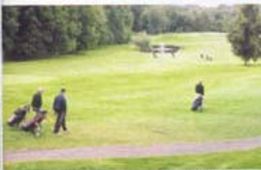
Till Knistad hör flera stora golfbanor.