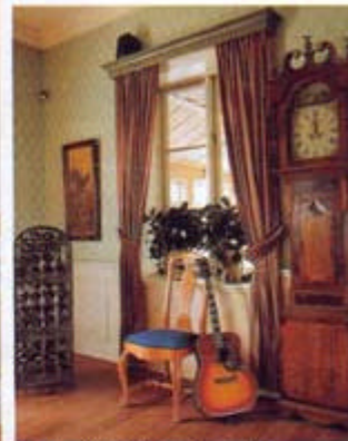
Golvuret tillhör herrgårdens äldsta inventarier. Tavlan t v är inköpt på auktion.