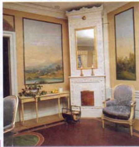
Sovrum i blåa toner – från början fanns bara en handfull övernattningsrum men nu har man byggt till en del i annexet.