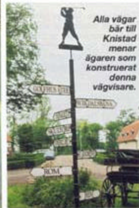
Alla vägar bär till Knistad menar ägaren som konstruerat denna vägvisare.