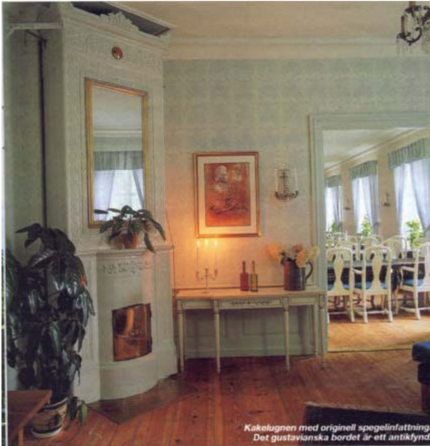
Kakelugnen med originell spegelfattning. Det gustavianska bordet är ett antikfynd.