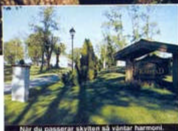
När du passerar skyten så väntar harmoni.