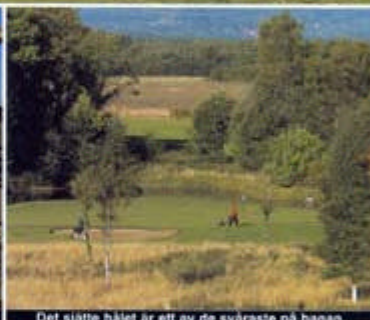
Det sjätte hålet är ett av de svåraste på banan.

» Vi har vår målsättning klar. Knistad ska ha den bästa maten, det bästa golfspelet, den bästa underhållningen och de bästa rummen. «