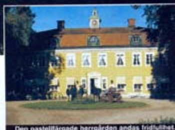
Den pastellfärgade herrgården andas fridfullhet.