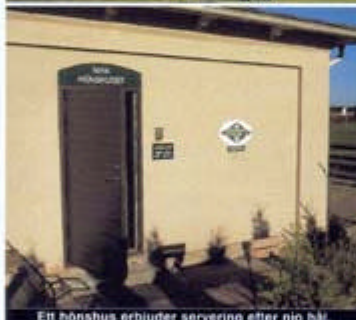
Ett hönsbushus erbjuder servering efter nio hål.